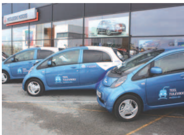
Kolme elektriauto saabumine