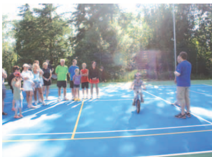
Iru küla tenniseväljaku avamine