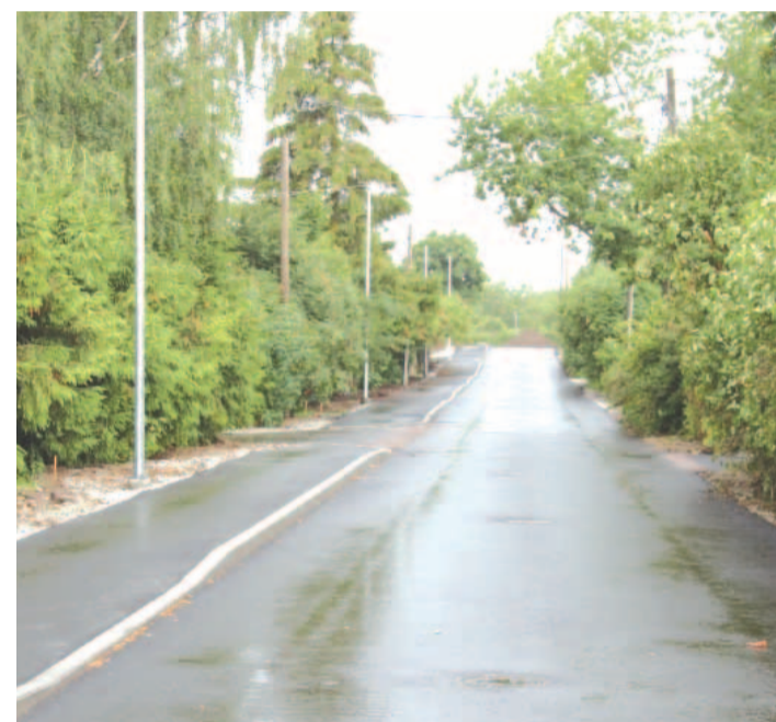
Iru kergliiklustee avamine