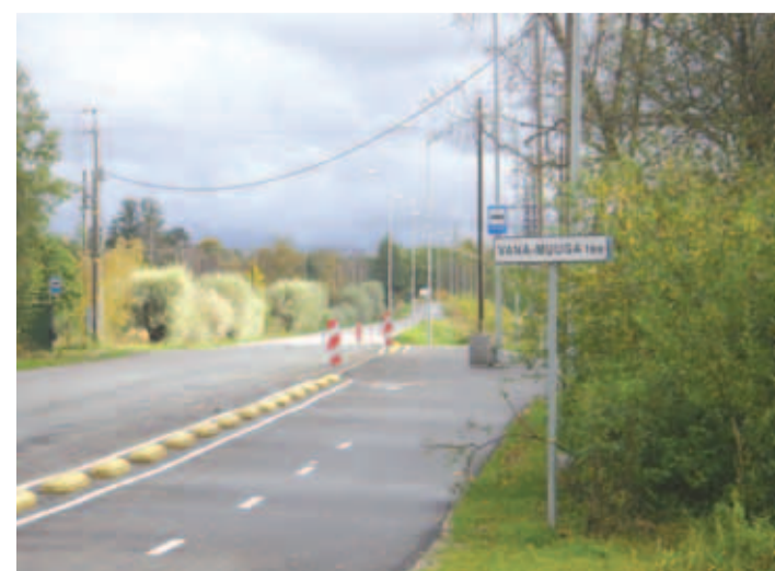
Uusküla kergliiklustee avamine