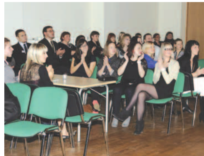
Loo kooli 25. aastapäev