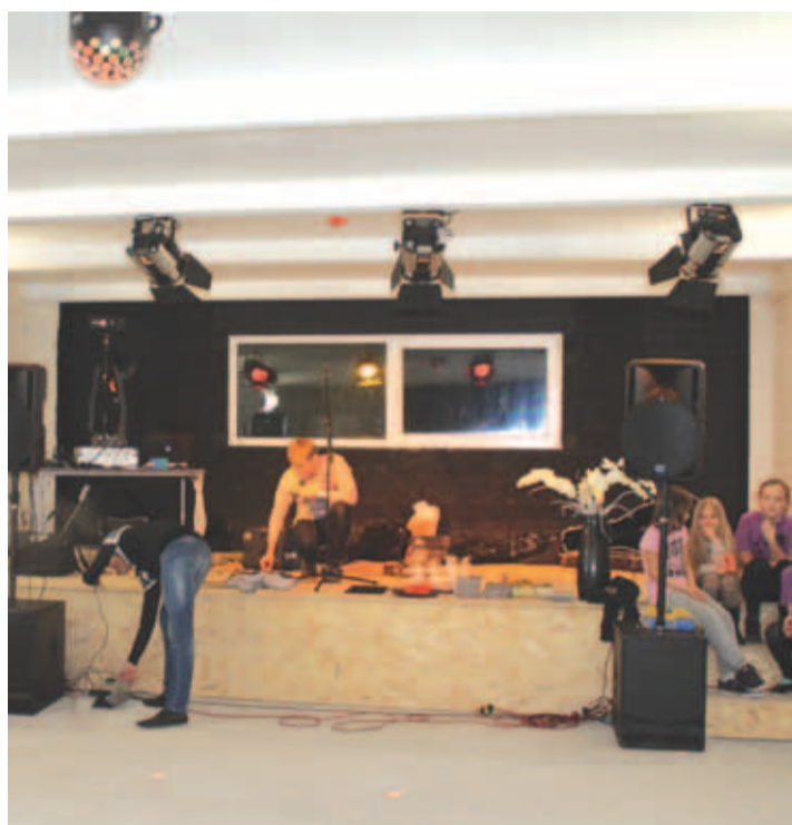
Kostivere noortekeskuse saali avamine