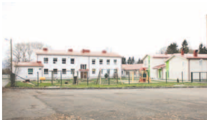
Loo lasteaia uue osa valmimine ja vana osa soojustamine Priit Põldma