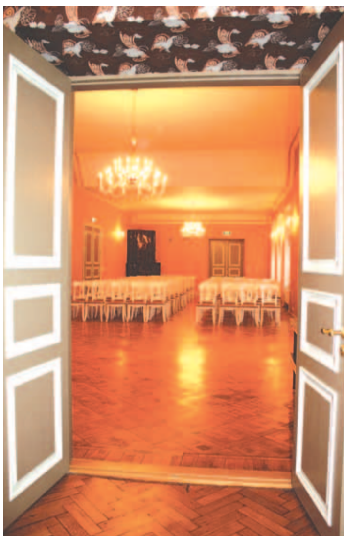
Kostivere mõisa saali avamine