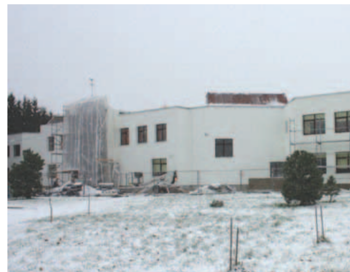
Loo keskkooli soojustamine