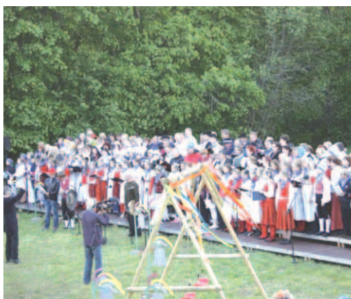
Jõelähtme laulupäev 2012