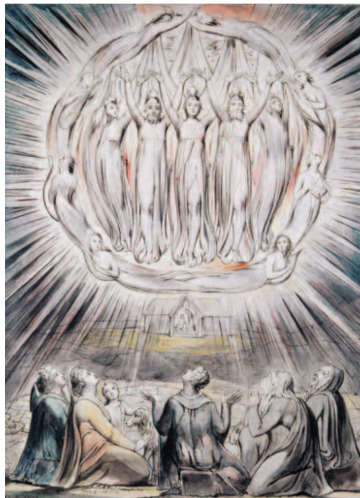
“Inglid ilmutavad end karjastele”. William Blake, 1809.

Soovin teile kõigile rõõmu ja rahu südamesse ning kauneid ja õnnistatud algavaid pühi.