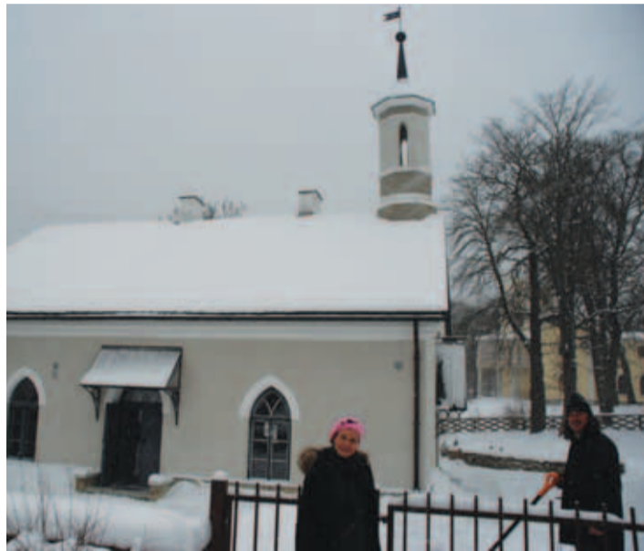
Köögist joa poole jääb 2004. aastal taaskäivitatud elektrijaama hoone. Paremalt on näha uuenduskuuri saav mõisa peahoone.

Ehitusaeg oli pikk, sest maja on kaitse all ja talitada tuli vastavalt nõudmistele. Seinu sirgeks ei aetud ning neid püüti ikka naturaalse krohviga katta. "Ja kogu aeg tuli midagi uut välja. Näiteks jõe pool asub põranda all paevooderdisega veekanal.